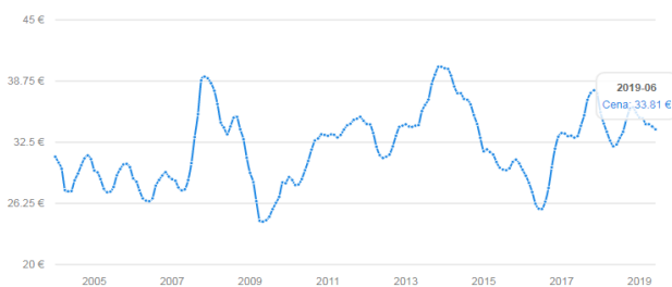
Nákupná cena surového kravského mlieka v EÚ (EUR/100 kg) za 2019/06